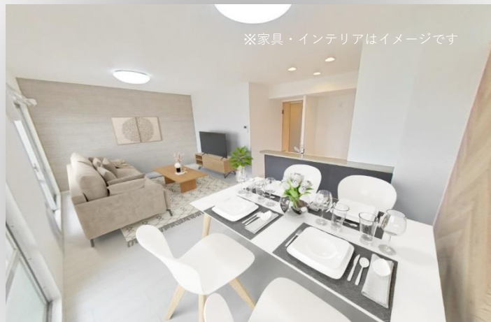
※家具・インテリアはイメージです

一瞬のトキメキが、一生の満足に。 a flash heart beat will be eternal satisfaction